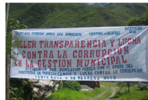
Banner del Taller

El Ministerio de Transparencia Institucional y Lucha Contra la Corrupción, participó del taller enviando un experto en la materia para que explique los cambios que se experimentaron desde que en marzo de 2010, se promulgara la Ley "Marcelo Quiroga Santa Cruz".