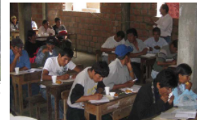
Interacción entre los asistentes y el expositor

La evaluación que se hizo posteriormente fue favorable y se la dio a conocer a través de una memoria que recogía todos los documentos y actividades previas y posteriores al Taller, este Sábado 3 de marzo en la Asamblea General de la CAU-Yanacachi, ocasión que fue aprovechada también para que Fundación Pueblo hiciera entrega de una propuesta de convenio a largo plazo para capacitación de líderes sindicales en temáticas referidas al marco normativo vigente desde el nacimiento del nuevo Estado Plurinacional.