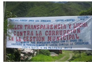
Banner del Taller

El Ministerio de Transparencia Institucional y Lucha Contra la Corrupción, participó del taller enviando un experto en la materia para que explique los cambios que se experimentaron desde que en marzo de 2010, se promulgara la Ley "Marcelo Quiroga Santa Cruz".